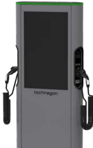
mit AGK (angeschlagenes Kabel) als Option